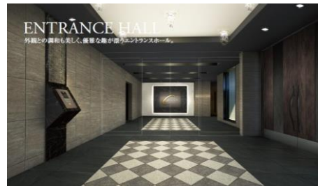
ENTRANCE HALL 外観との調和も美しい、豪華な能が際立つエントランスホール。