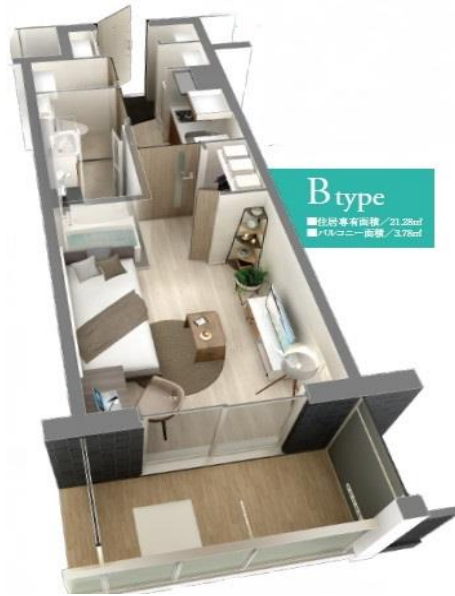
B type ■住居専有面積 / 21.28㎡ ■バルコニー面積 / 3.72㎡